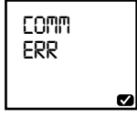
Data transfer is failed