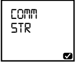
Data transfer started