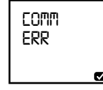
Veri aktarımı başarısız