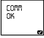
Data transfer is successful