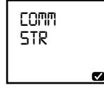
Veri aktarımı başladı