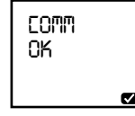
Veri aktarımı başarılı